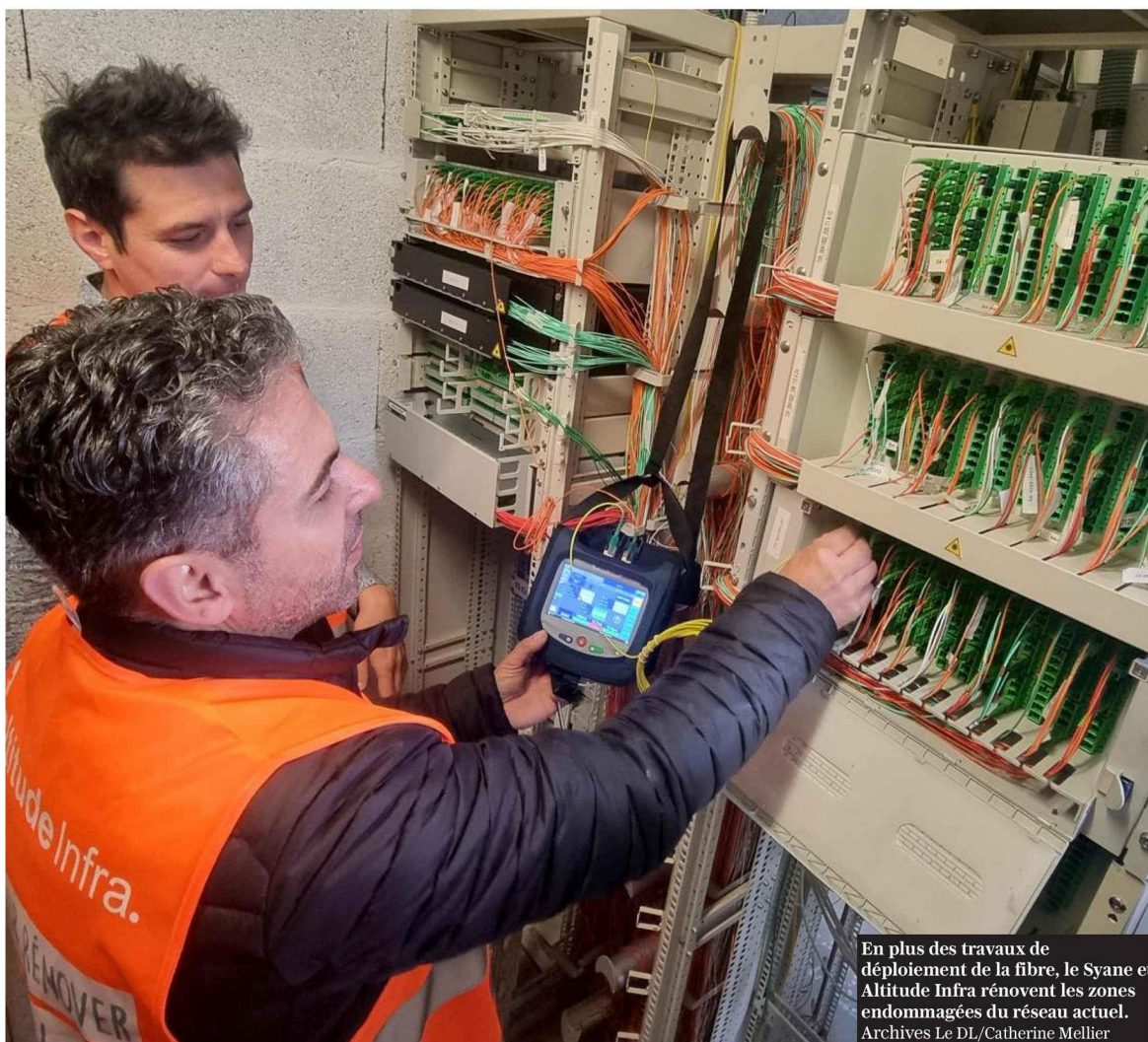
En plus des travaux de déploiement de la fibre, le Syane et Altitude Infra rénovent les zones endommagées du réseau actuel.